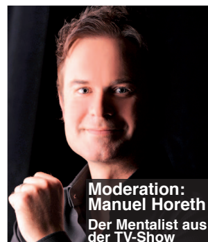
Moderation: Manuel Horeth Der Mentalist aus der TV-Show